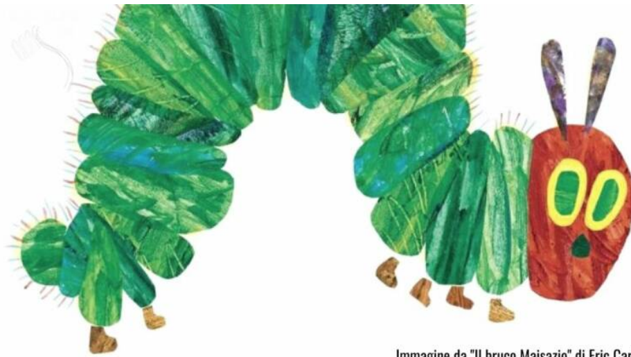
Immagine da "Il bruco Maisazio" di Eric Carle